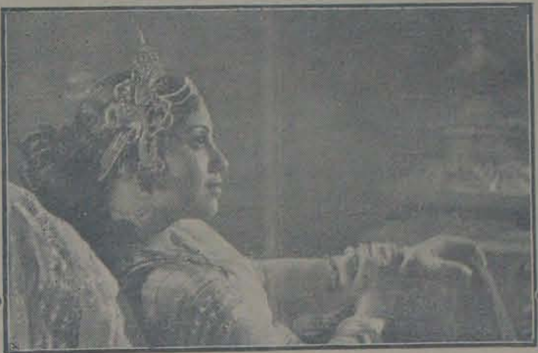
"సత్యభామలో" సత్య - పుష్పవల్లి

సానికి ప్రబోధించింది. ఆ ప్రయత్నంగా, పాత్ర క్రమంగా అభివృద్ధి అన్వాయాన్ని మ్రొంగుకొని అతని వాగ్దానంతో తృప్తి చెందింది. దుఃఖం మరిచిపోయింది. అంతటితో ఆమెకమ్మలు గట్టికొచ్చారు. వీమలను వేలు వెళ్ళాడతాడని తెలియగానే ఆమె కులిపోయింది. "మానకారి కామ దానలూటలు నీటిమాటే" నా అని ఆమెకున్న