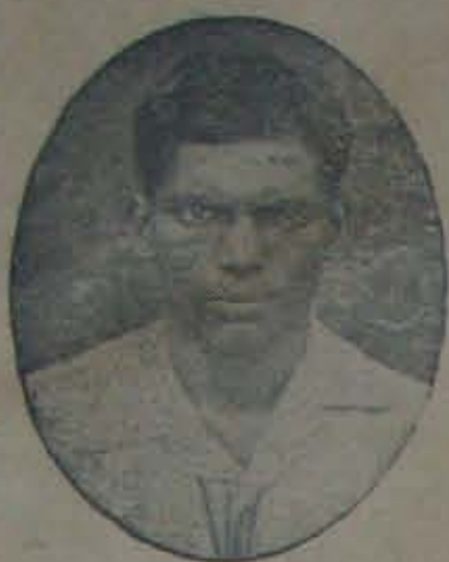
వి. యస్. వెంకటనారాయణ యం. ఏ. డి. ఇ. డి.