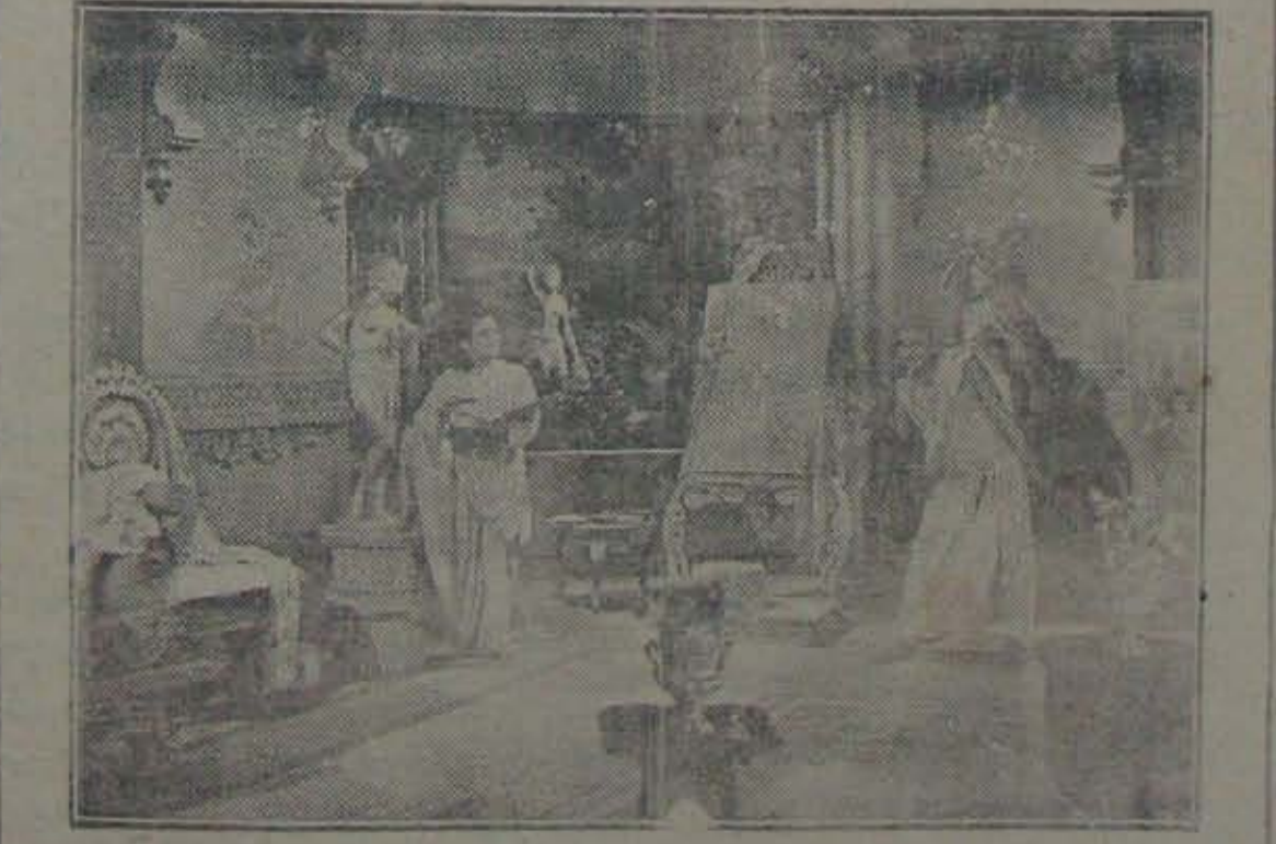
భక్తిమా లోని దృశ్యము