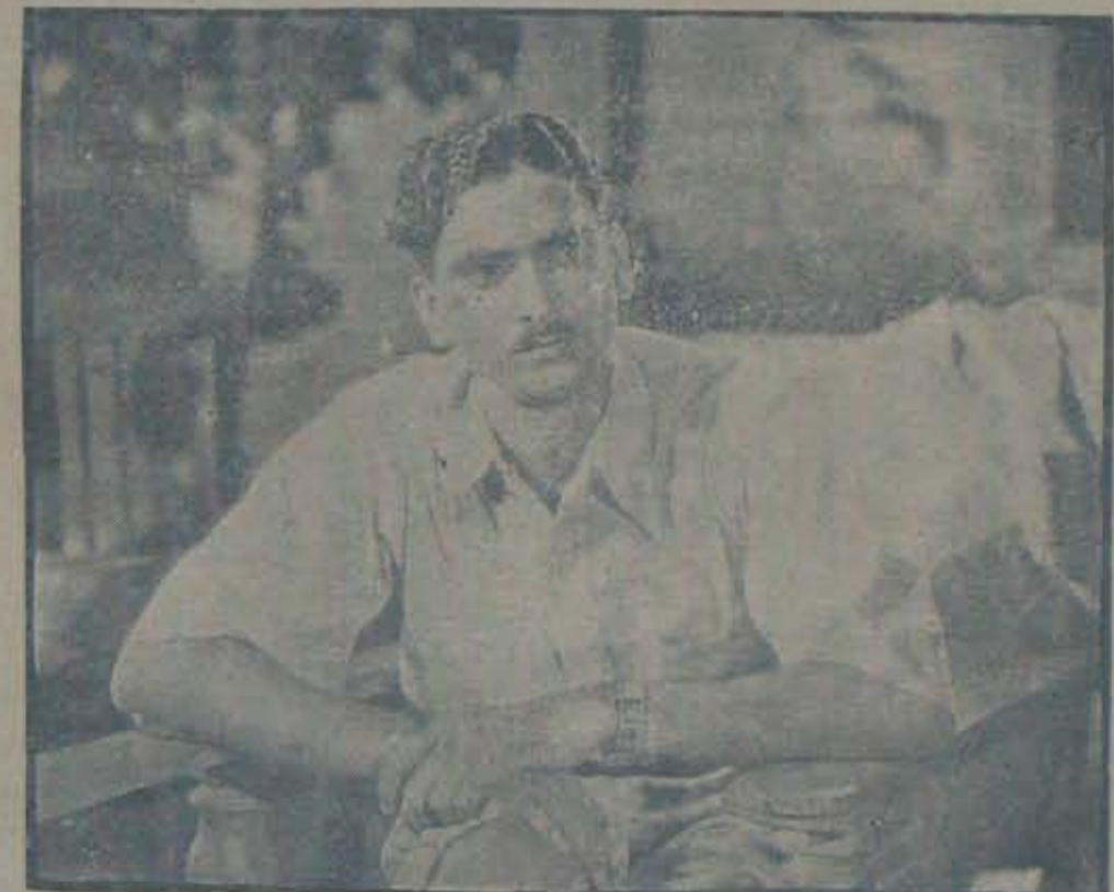
శేనరి కుటీరం లిమిటెడ్ - మద్రాసు

ప్రకాశ్ : సదయపూరియుడు, స్నేహపూరితుడు, సాత్విక సంపన్నుడు. ఇంతటి మేల్తనివానికీ శత్రుడుమాటలవల్ల చిత్తము వికలమైంది. ఆ చంచల హృదయంలో అగ్నివర్షితం బద్దలయింది... ఆనుకూలదాంపత్యం కిథిలం కాజొచ్చింది. దినంతోకూ ... ఆ శలుగురూ వేసిన ఆపవాదే... —కన్వూరివారి 'ఆపవాదు'లో కథానాయకుడు ప్రకాశరావు.