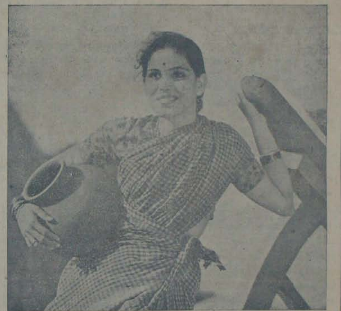
వాహినీవారి "దేవత" లో