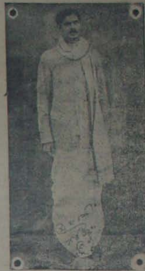
వీరు తిరుమనాపల్లి కైలువండి 8 తేదీ విడుదల కాలడి 7 తేదీ వూ కావలి ప్యాసింజకులో నెల్లూరు వస్తురు.