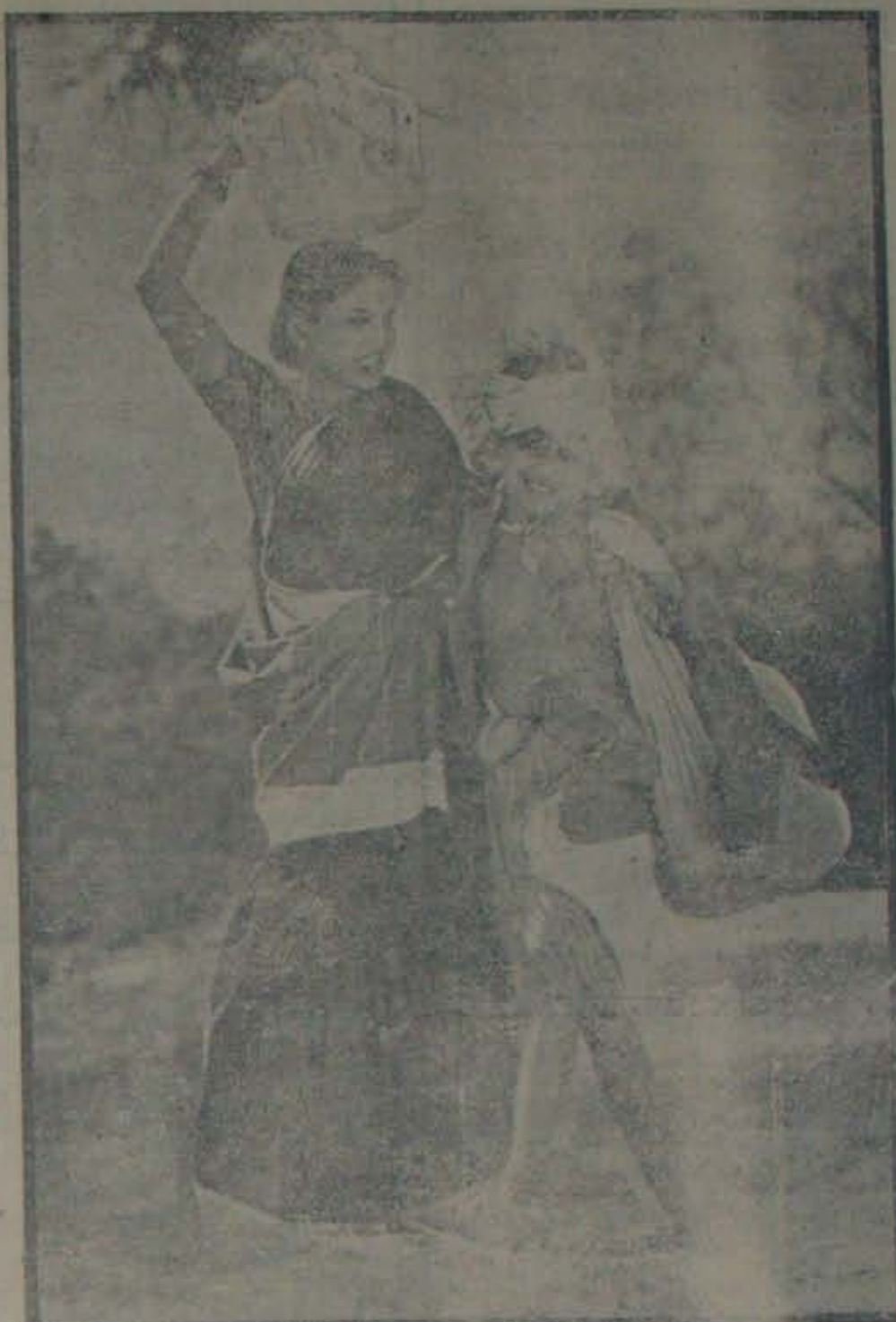
వాహినీనారి ఉత్తమ చిత్రం 'జేవర' లో

మద్రాసులో ఆంధ్రుల పోషణలో, ఆద్యంతం ఆంధ్రస్వాన్ని సాక్షాత్క రించే ఆంధ్రులు గర్వం చేసినది శోభనాచలస్తుడియో ఒక్కటే! విశే కానికి కొన్ని సంస్కరణలు కావాలి.