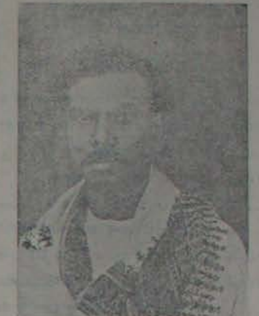
మీరు కుండు మార్కు సత్యాగ్రహించేయగా 1 నూటు వెయ్యిరూపాయలు, 2వ నూటు నూటు ముహూరు రూపాయలు కాల్చావా విధించుటడెను. మూడవదఫాకు కిచ్చంగానున్నాడు.

కు 1118 లచే బహుశాశించబడిన అనువల్లి సుబ్బారామరెడ్డిగారు (నూదూరు)