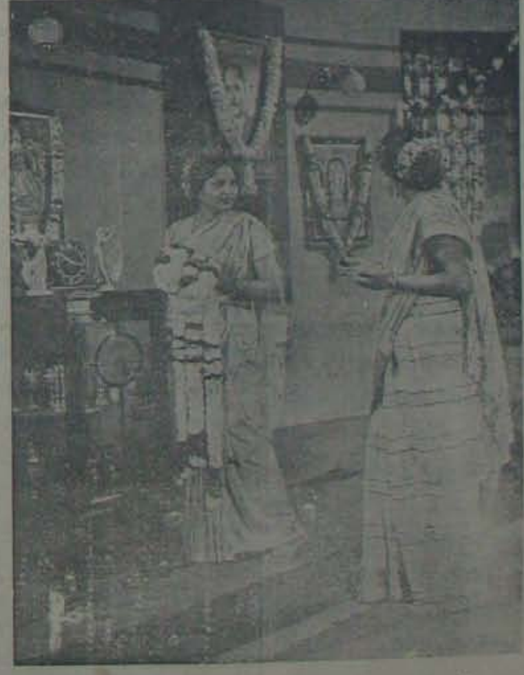
“అమ్మా! పెళ్లివారోచ్చారు!” — జానకి. — శ్రీ రాజరాజేశ్వరి ‘తల్లిప్రేమ’