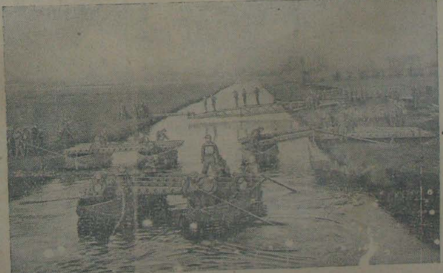
బ్రిటిష్ సేగయొక్క రాయల్ ఇంజనీర్లు, యుద్ధసమయంలో నదులు దాటవలసి వచ్చినపుడు, త్వరగా ఏలా బ్రిడ్జలు నిర్మించాలనీంది ఆలోచిస్తున్నారు.