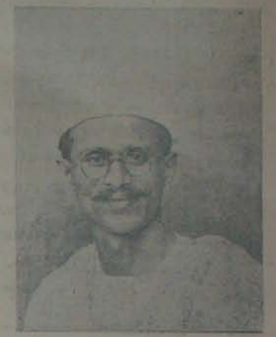
వీరుని నెల్లూరు సత్యాగ్రహం చేయగా శిక్షిం నక పడిరి, 20 తేదీ తిరుగా డిల్లీ జైల్లులో తోటపల్లి గూమాలులో ఆరెస్టుచేసిరి.