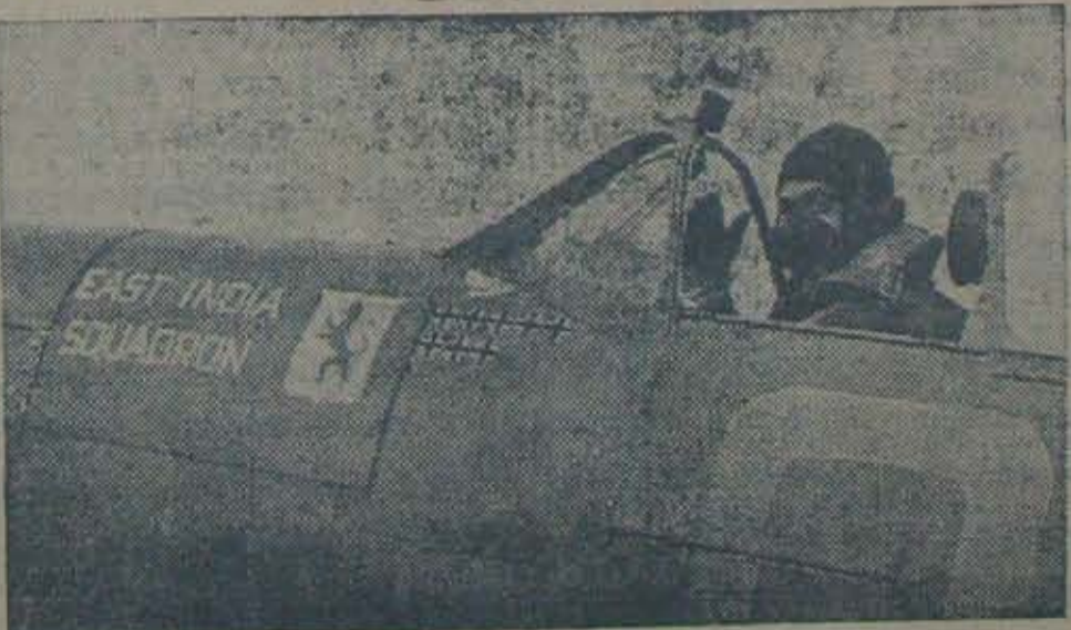
ఈస్తు ఇండియా 'స్ట్రాబెరన్' అను బ్రిటిషు క్రొత్తవిమానము ప్రాస్సులో విశ్వవిహారము సలుపుట.

ఒకసారి "వెల్కమ్ బీడి" త్రాగిచూచిన దాని సువాసన, శ్రేష్టక మికు తెలియగలదు.