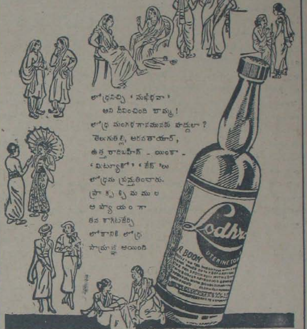
లోధ్ర - గర్భాశయరోగ నివారిణి