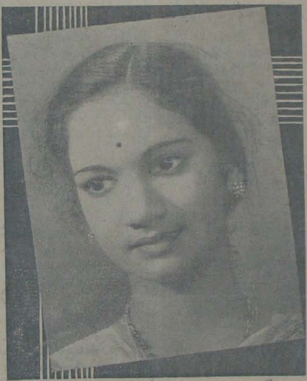
శ్రీకాళి చెల్లెలు - కాంతం. చెల్లిబాగులూనినది ఆగపడుతుంది. వయసుకీ మించిన తలపులు - కత్తికీమించిన చేతులున్ను...