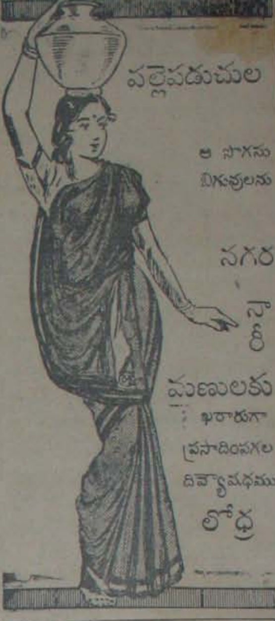
శేరి కుటీరం లిమిటెడ్ - మద్రాసు

అని యేమో చెప్పటకు ఉపక్రమించుకుండగా సభ్యులెల్లు వెళ్లినారు సభలో నేనూ, ప్రెసిడెంటు, ఉపన్యాసకుడు మాత్రమే మిగిలితిని. ప్రెసిడెంటువారు లేచి “మహాశయులారా? నెల్లూరు పురప్రముఖులు గుమిగూడిన ఈమహాసభలో తీవ్రకారుణ్యమునుగూర్చి మహాశయాసమును గావించిన శ్రీ శ్రీ .....వారికి సభాసత్మున సమస్కారములుచేయుచూ ఈసభ ఇంతటితో ముగించుచున్నామని చెప్పి లేచిరి. సభలో కరములులేవు కాబట్టి కరతాళధ్వనులు వెలరగలేదు.