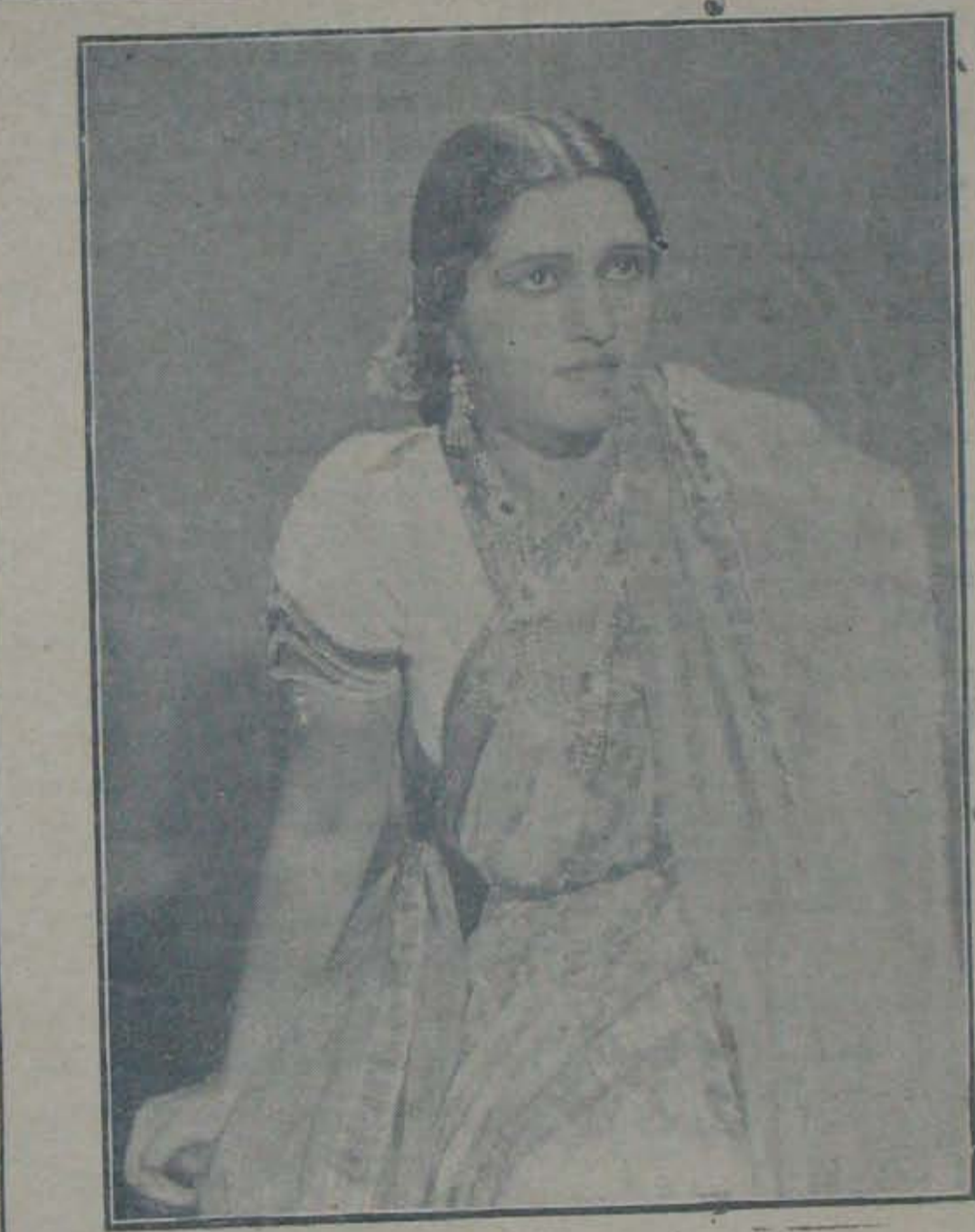
“భక్తి మాలలో” వెంటటగిరి.