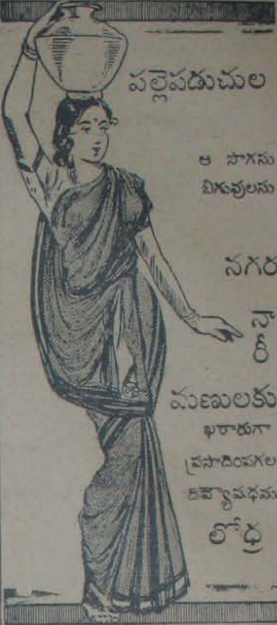
కేవల ముగ్గురికి లిమిటెడ్ - మద్రాసు

ఆదాయాభి: సమగ్ర దేశమంతటను ఇక్కడ కర్షకుల లెక్కలు తనిగి చేయుచుండెను. కొందరు ఇక్కడ కర్షకుల వస్తుసామగ్రి, ప్రభుత్వపు ఆదాయము పరిశీలించుచుండిరి. మరికొందరు ధూమి నీటిమీదవచ్చు దిగుమతి మంకములు, గోటుపన్ను, కోట్టుపన్ను, బండ్లపన్ను, వైవిక పన్ను, పడవలచార్జీలు, వర్షపు ఆదాయము గవర్నరు మెంటుస్థలములలో నుంచబడ్డందుకు బాదు గలు వగైరాలు, మారుమూలలో సవ్యానులుగా