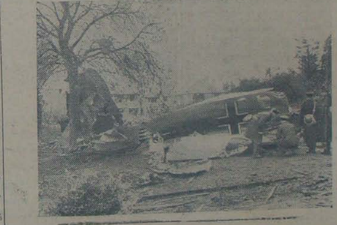
బ్రిటన్ కు తూర్పుతీరంలో ఉండే ఒకపట్టణంలో వడగొట్టబడిన జర్మను విమానం.

వావాటికి రుమేనియా పూర్తిగా వాతకం కాన్ని ఆవసరియూ వున్నది. బొమ్మినీ మైవారిటీ ఎత్తువగావుండే స్థానిక సంస్థలయారు బర్మీను కు మురు నియంపించబడుతున్నారు. ఇంకా ఇతర క్రా : పరపాలనయంతో వాటి మయ మై పోతున్నది.