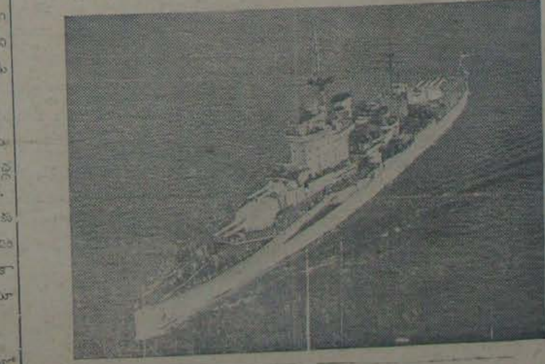
నార్విక్ లో బరిగిన L-వ సారి యుద్ధంలో పాల్గొనిన బ్రిటిష్ యుద్ధనావ. దీనియొక్క బరువు 30,600 టన్నులు.