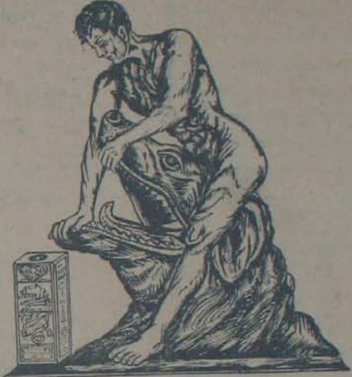
నరములకు తరుగని బలమునీయగల వరము