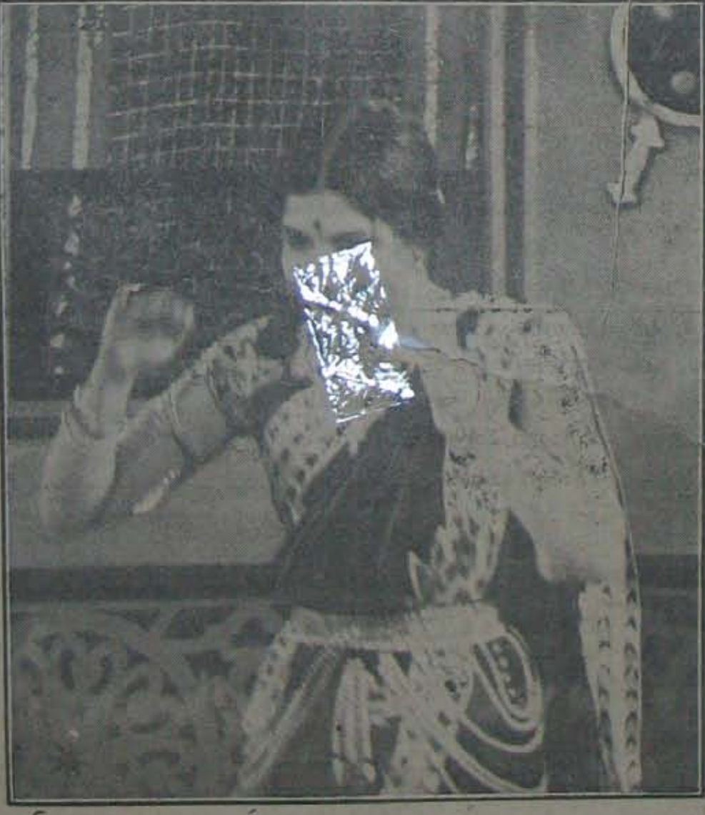
పశుకామాన్ని కోరే గోపీ మనస్సును పవిత్రత్రైమూర్తానికే తిప్పడానికి తార తన సర్వశక్తులనూ వినియోగించి చూచింది! కాని ప్రయోజనం? —కాలచక్రంలో తార పాత్రను ధరిస్తున్న ఉమాదేవి.

రూపవాణి మద్రాసునుంచి "రూపవాణి" అనే కొత్త తెలుగు సినిమాకు ప్రతి మార్చిలో తొలి సంచిక వెలువడుతుంది. సినిమా విషయాలన్నీ, సమగ్రంగా కర్పించడమే యావత్రిక పుస్తకము తెలుస్తుంది. (విశేషం)