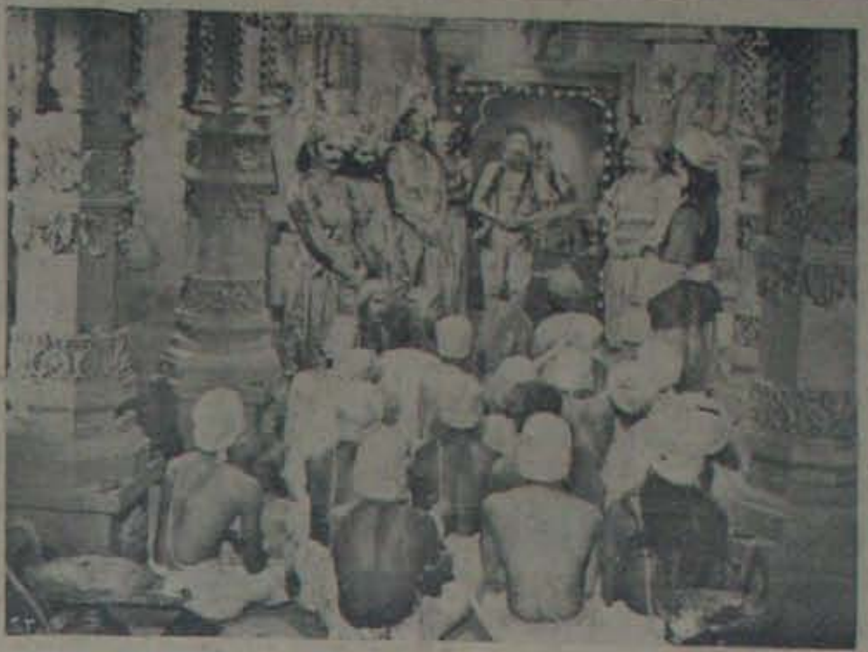
నవ్యకళా ఫిలిముస్వారి 'మీరా రా బాయి' లోని ఒకదృశ్యము.

అన్నగారి వివాహం... ఆ భార్యభర్తలు వివాహ మంటపంపై కూర్చున్నప్పుడు ఉమామావిపాండిన సంతోషం ఆమెలోని యవ్వనపు బ్యాలను ప్రజ్వలించలేసినవా?