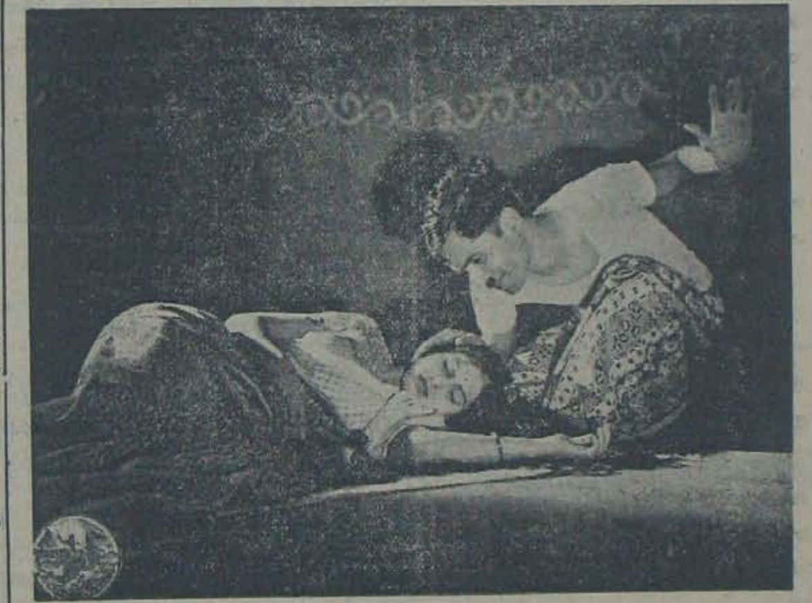
వాహినీవారి “సుమంగలి” లోని ఒక దృశ్యము—

అమాటలో ఆమె పొంగిపోయింది. పరుగెత్తుకునిపోయి చేతుడు గింబుల దెచ్చి బోలెలో