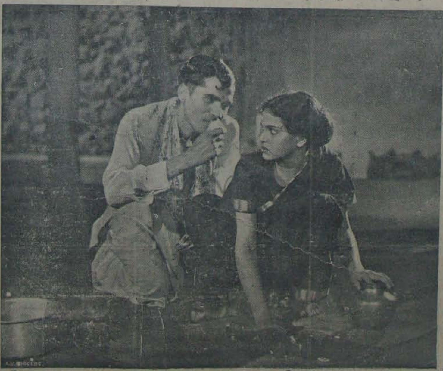
వాహినీవారి "సుమంగలి" లోని కుమారి, పిళ్ళయ్య.

10 తేదీ నెల్లూరులో మంచివాని కురిసింది 11 తేదీ ఎకావూరుమంది తేదీకాకా 4 నిమిషం కన్నం కురిసింది. దీన్ని మా రాజుకృష్ణ సిద్ధాంత గారు లోకర్లు అంటారు. ఈవర్షాలు కొండలు ఆడవుల ప్రాంతాల్లో గూడ కురిసింది పు గ్రామమున్నా పుట్టిక ఉచూరూ! బరవరెడు.