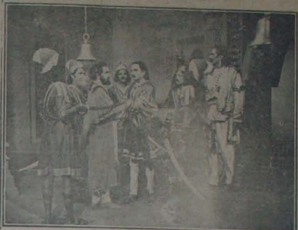
అన్నను హాస్యగావింప సిద్ధపడిన ప్రచంతురి బంధువులను ధీరముల్లుడు: ధీరముల్లు : డి. రాఘవ. —భవానీవారి "చరిత్ర" నుండి.

ఈ ఫిలిం ప్రత్యేక ప్రాశస్త్యాన్ని గూర్చి తర్వాత—