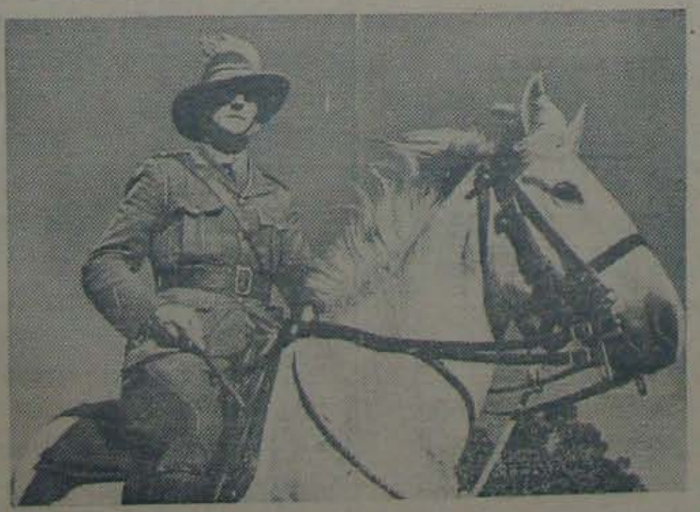
బ్రిటిషు సామ్రాజ్య యుద్ధసన్నాహంలో స్థానాధిపతులకు సిద్ధమైవచ్చిన ఆస్ట్రేలియను స్వారీదళంలో ఒక సైన్యాధికారి.