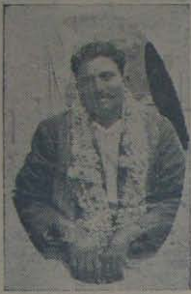
నంద్యాల తాలూకా బ్రాహ్మణవర్ణి గ్రామం దాట్ల నారసిరెడ్డిగారు వధివుతిండ్రి "నోభూమి" పత్రికకు రు 116 లుచ్చిన వారలు.