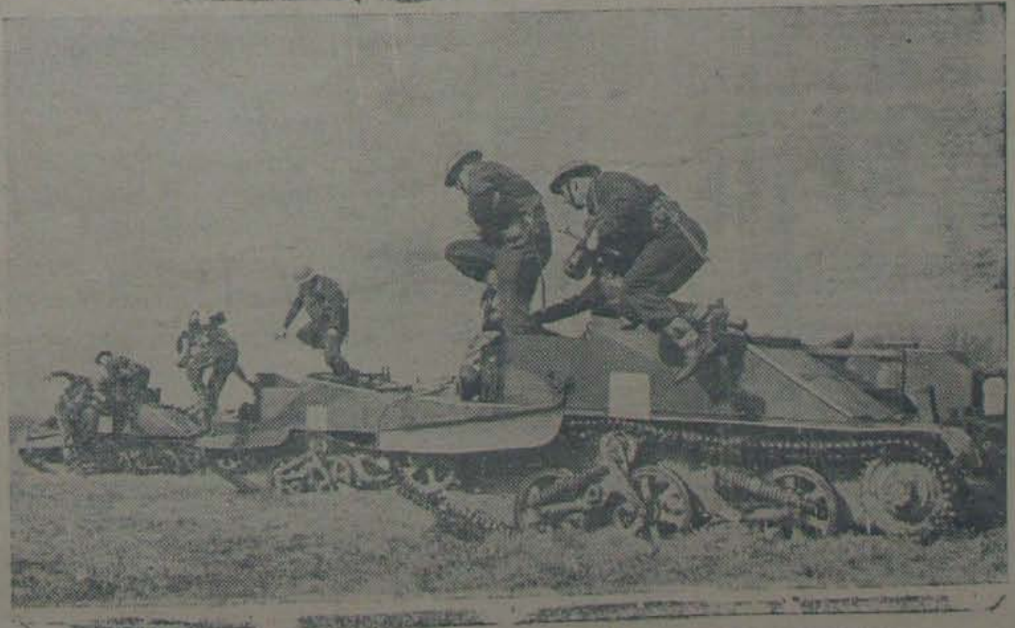
వైద్యక తర్కీదు నిన్నాహాలు - బ్రిటిషు సైనికులుచేసే ఆటంకాలకు, వైదువు తుపాకులు అనుర్విస ఈబండ్ల మీదనుండి, ఆస్ట్రేలికులు దూకుతున్నారు.