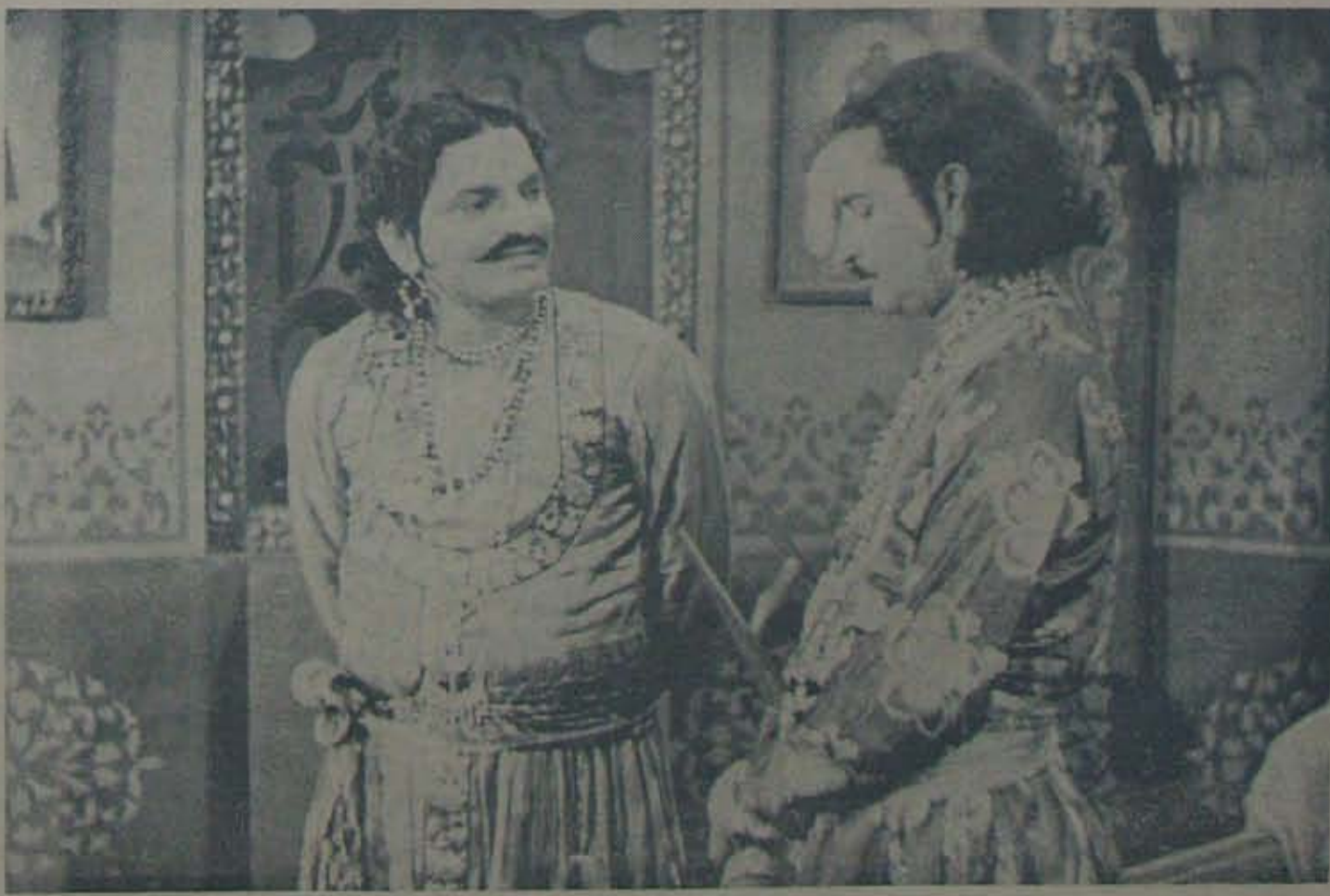
భానుసీంహా! మన ఇద్దరి మధ్యా అల్లారుముద్దుగా పెరిగింది ఉమ. చిన్నప్పట్నుంచి పెంచుకొచ్చి ఈ నాడు చేతులారా తుంచినేస్తావో రణధీర్! నీతో పెరిగిన చెలికాడు... శివాచారాణినింటి దారుణియో! సవ్యకా ఫిలిమ్స్ వారి మీరాబాయిలో సన్ని వేశం.

పెనెడెంటు, ఆం. రా. రైతుసంఘం. సంలి కార్యదర్శి, ఆధులభారత కేసాన్ కమిటీ.