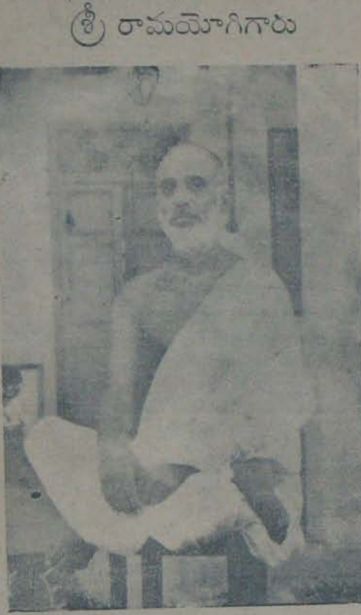
వీరి 46-వ జన్మదినోత్సవం 11-8-40 తేదీన అన్నారెడ్డిపాలెంలో విజయవంతంగా జరిగింది.