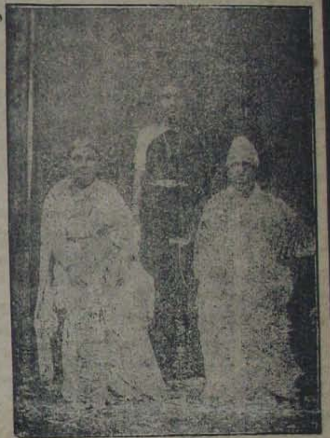
పంతులు - భార్య - కుమార్తె.

బొంబాయిలో అమృతాంజనపు నాటి నాగేశ్వరరావు పంతులు.