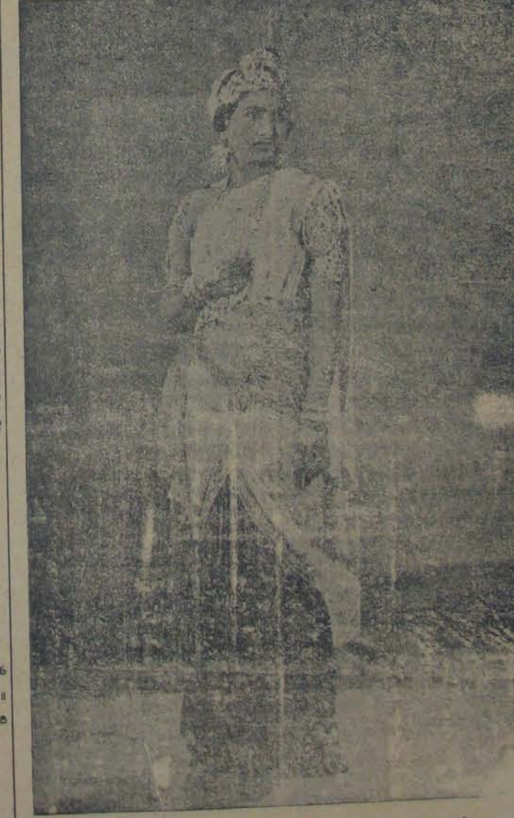
“మోహిని భస్మాసుర”లో లక్ష్మీపాత్ర వహించిన వారికి కోటిరచ్చ