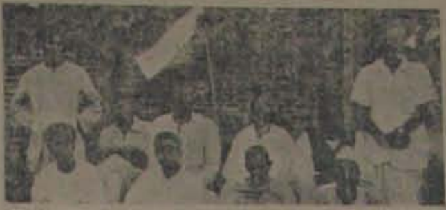
విశాఖపట్నం జిల్లా రాజకీయ బాధితుల సంఘం. విశాఖపట్నం జిల్లా రాజకీయ బాధితుల సంఘం.