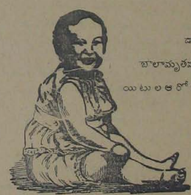
డాంగ్రేగారి బాలామృతము సేవించిన బిడ్డలు యిటుల ఆరోగ్యవంతులగుదురు