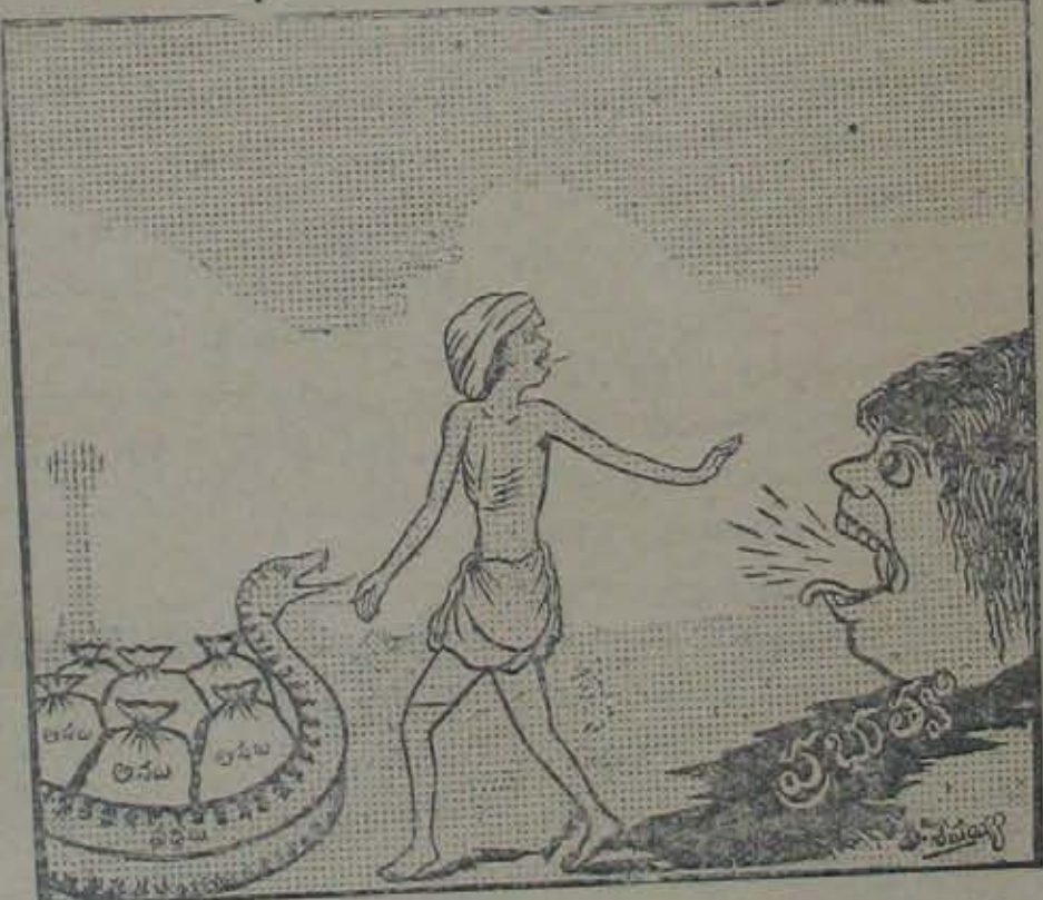
అటు ఋణబాధ, ఇటు ప్రభుత్వపు పన్నులవేగ ఏలాధరించేదిరా చేముడా!

చీట్లువ్రాస్తూవుండేది. చీట్లుతెచ్చే మారన్నను 4-వ ముద్దాయి భయ వెట్టిపంపివల్ల తర్వాత చీట్లు మారన్న చేయవ వ్రాయడం మొదలు వెట్టింది 4-వ ముద్దాయి ప్రాణభయము కలిగించేటట్లు దొరకించడమవల్ల మావారు డబ్బుయివ్వడము మావారి వారు తమవారే ముద్దాయిలు బయి పురం వెళ్లిపోయినారు. 6 బరంపురం రావలసింది యిచ్చి ఇచ్చివేస్తాను " అని ఆపుతరములో వుం డిని మావారు చెప్పినారు. కేసు వర్షలని చెప్ప వట్టికెట్టి భయములేదని చెప్పి మావారు ఆది వారం బరంపురం వెళ్లివారు. బుధవారంనాడు 1-వ ముద్దాయి పితాపురం వచ్చాడు. మావారిని గురించి కలుసుచేశాడు. మావారు రాశే 3,