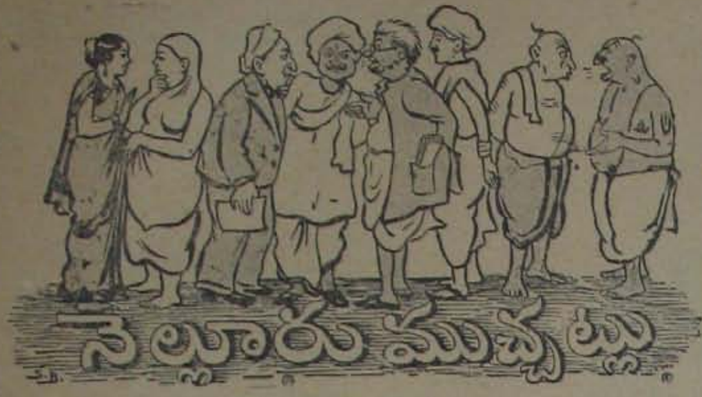
(వి మ ర్శ కు ము)

అన్ని ప్రతికూలమైన నిషేధాలు తొలగిస్తున్న యీ కాలమునకు ప్రభుత్వపు దిశాల్లో వైవా జ్యికా రైతు ప్రతికూల నిషేధాల తొలగించి అకేంద్రపద్ధతి ప్రకారం నెల్లూరు రెండు జిల్లాలో పులవారు?