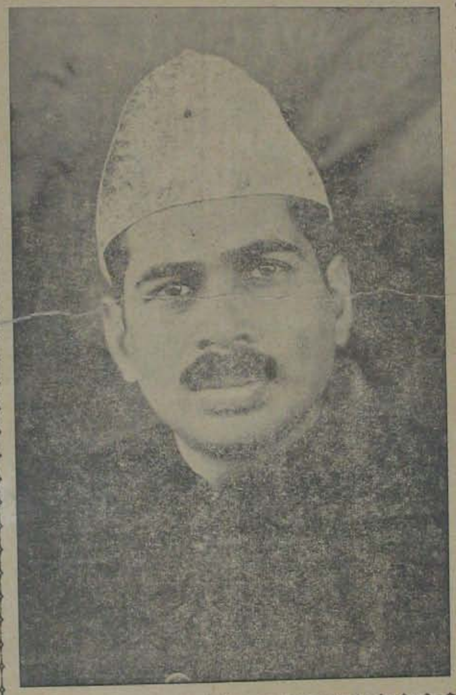
వయస్సు 30. మూడుమాసాలు 20-5-30, 1-9-30, 26-6-32 తేదీలలో శిక్ష విధించబడి జైలుకు వెళ్లినది.

గౌ. బెజవాడ గోపాలురెడ్డిగారు మద్రాసు ప్రభుత్వ స్థానిక సరిపాలనాశాఖ మంత్రి.