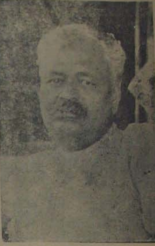
సంయుక్త రాష్ట్రముల కాంగ్రెసుపక్షపు ప్రధానమంత్రి.