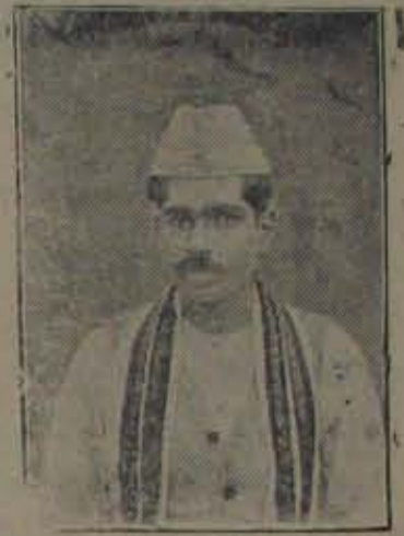
మద్రాసు ప్రభుత్వ స్థానిక స్వపరి పాలనాశాఖమంత్రి 14-7-37 తేదీకి ఆధికారము స్వీకరించిన, పీఠ యున్న 80 సం॥

మంత్రీత్వాల్లో సమానత్వం మావశికపో యినా కార్యదర్శిత్వాల్లోనైనా సరిసమానత్వం ప్రసాదించకూడదా అంటాడు అంతరంగిత్వంగా ఆభావనావిరక్తితో కార్యయ్య ఎల్.ఎల్.గి. గారు.