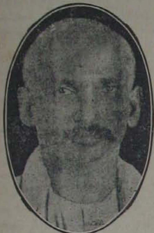
అంధ్రరాష్ట్ర కాంగ్రెసు సంఘాధ్యక్షులుగా ఎన్నుకోబడిరి.