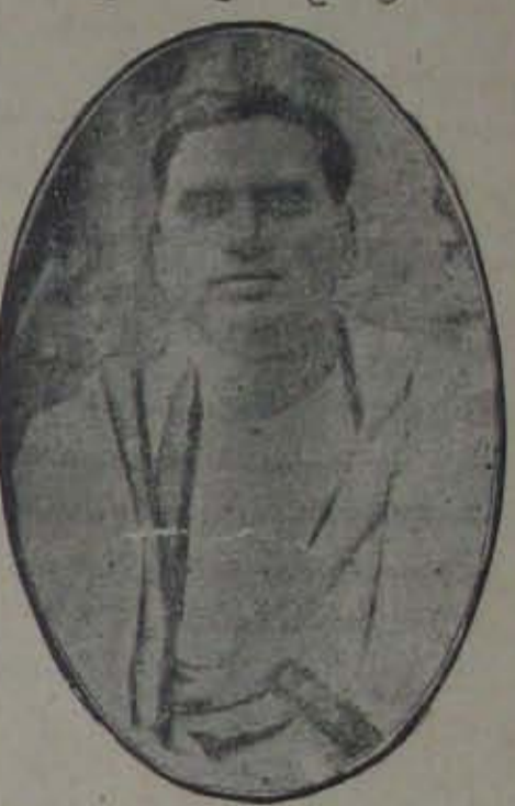
ప్రధాన కార్యదర్శిగా ఎన్నుకోబడిరి.