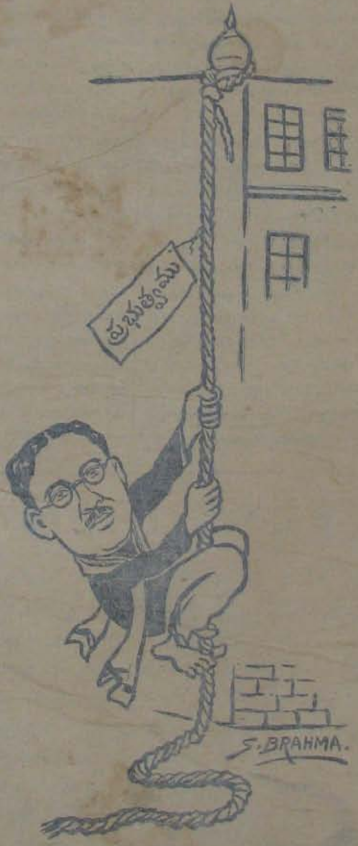
సారీ! చెద్దవారెక్కడి ఈ మార్గాన్నే నా?