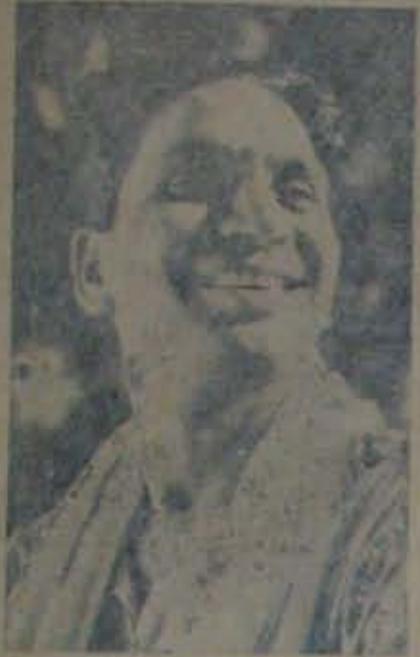
కొంకణం జిల్లా కలెక్టరు పంపాదరణం జిల్లా కలెక్టరు. ఈ పుస్తక పుస్తక రచనా కృషికి. చాలామంది సహాయం చేసిన విద్యార్థులు వ్రాయు బిల్లులు.