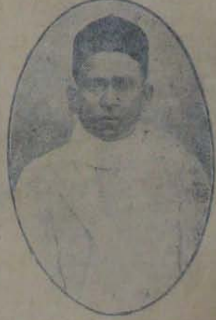
పుస్తక పుస్తకా పంపాదరణం.