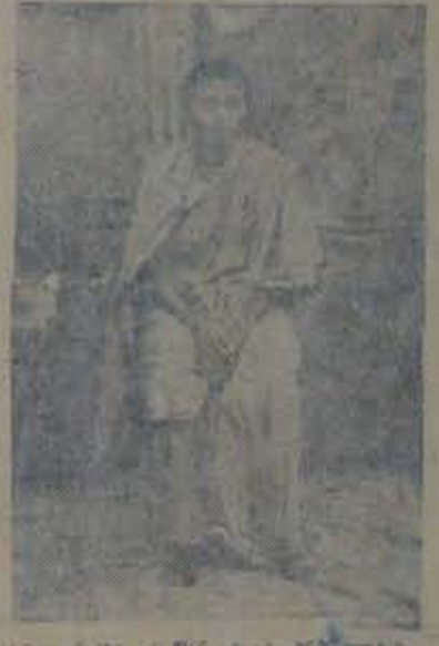
కొంకణం జిల్లా కలెక్టరు పంపాదరణం.