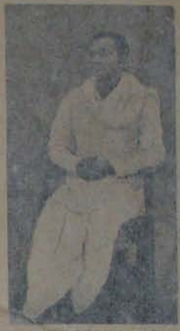
కొంకణం జిల్లా కలెక్టరు పంపాదరణం.