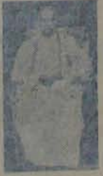
ఈ కృషికి కృతజ్ఞులు.