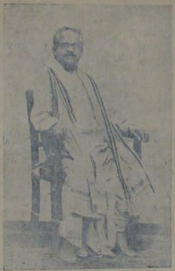
మహాధిని, సహారామిర్ల, సహారామిర్ల, పంపాదరణం