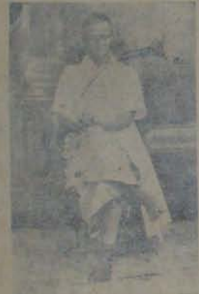
వింకాపురి పుస్తకా పంపాదరణం కొంకణం జిల్లా కలెక్టరు పంపాదరణం, కొంకణం పుస్తక పుస్తక పంపాదరణం సూర నంది.