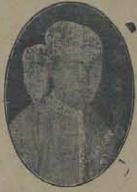
రంగూను కెమికల్ డైమండుసే డెవలప్మెంట్ డివీజన్ గింపుడు.