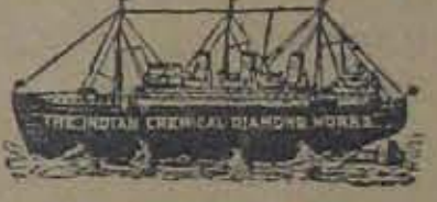
యా స్టీమరు రిజిస్టరు ప్రేడు మార్కుగల ఆసలు