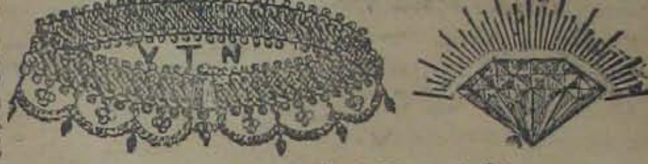
(సవర బంగారుకు వెండికి గ్యారంటీ.)