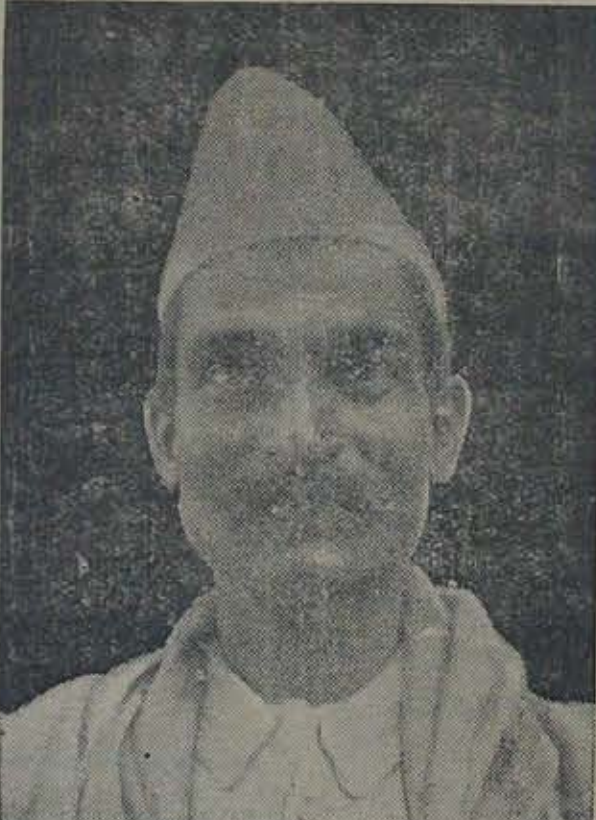
అఖిలభారత కాంగ్రెసు అధ్యక్షులు శ్రీ బాబూ రాజేంద్ర ప్రసాదుగారు.

అమెరికానుండి ఇటలీకి ఎగుమతులు. ఒక వంక ఆంతులని సమితివారు తెలుపుటచే, అమెరికానుండి కెరెబియన్లు, పత్తి వినికము ఎగుమతికొరకుటల తెలియుచున్నది.