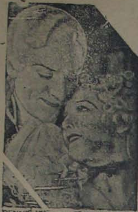
DENNIS KING and THELMA TODD in 'THE DEVIL'S BROTHER'

యిటువంటి గొప్ప ఫిలిములను ప్రదర్శించుటకు యిదే మొకటి తరుణము.