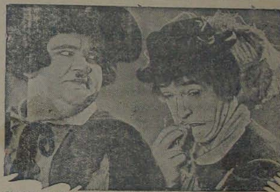
OLIVER HARDY and STAN LAUREL in 'THE DEVIL'S BROTHER'

తర్వలో:- “సతీ సక్కుబాయి” తెలుగులో మాట్లాడేఫిలిం