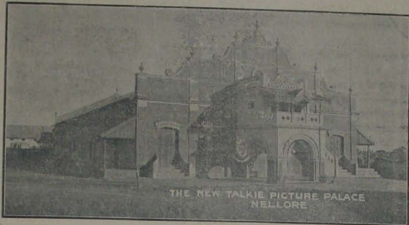
THE NEW TALKIE PICTURE PALACE NELLORE

పాత వారము మాత్రమే సోమవారము 20వేలమంది జనముచేత ఆకర్షింప బడి పొగడబడినది.