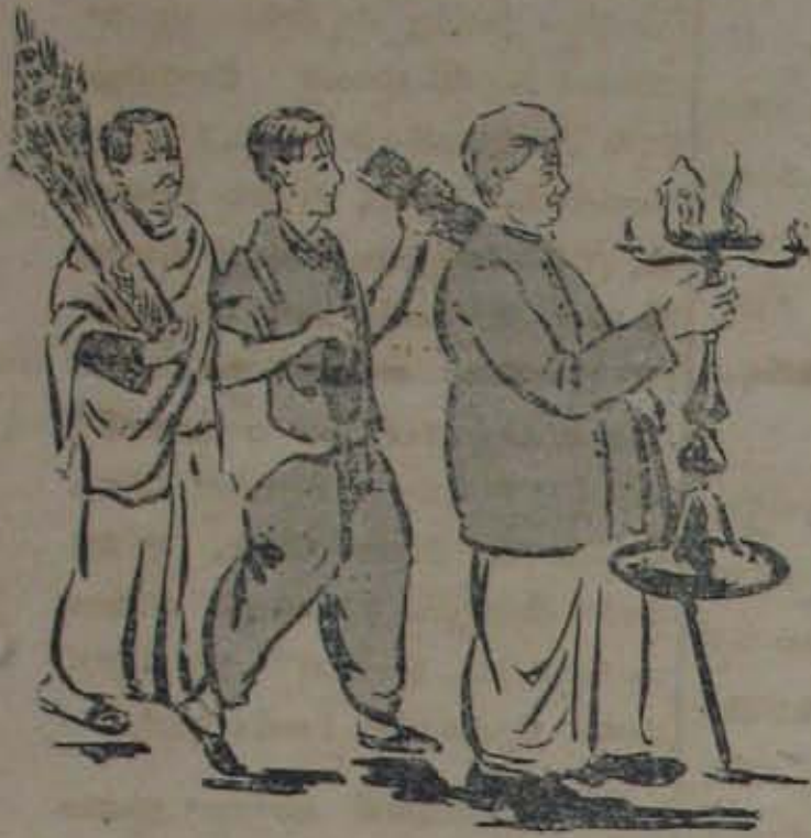
[రావు, కాశ్మీరీగార్లతోటి చానును కీపపు కెమ్మతో సభవంతు రామభజతో వైభవం కున్నాడు.]